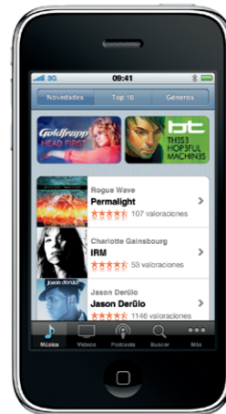
La tienda iTunes Store está disponible solo en algunos países.

Puede acceder a la tienda iTunes Store de manera inálábrica pulsando el icono iTunes. Busque música, películas, programas de televisión, vídeos musicales y mucho más. Puede comprar contenidos y descargarlos de la tienda directamente a su iPhone. Pulse cualquier ítem para ver o escuchar un fragmento.