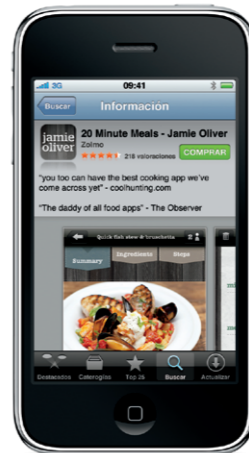
La tienda App Store está disponible solo en algunos países.

Pulse el icono App Store para explorar de manera inálábrica decenas de miles de aplicaciones clasificadas en categorías como juegos, economía y empresa, viajes, redes sociales, etcétera. Puede explorar por Destacados, Categorías o Top 25, así como buscar por nombre. Para comprar y descargar una aplicación directamente al iPhone, pulse Comprar. También hay muchas aplicaciones gratuitas.