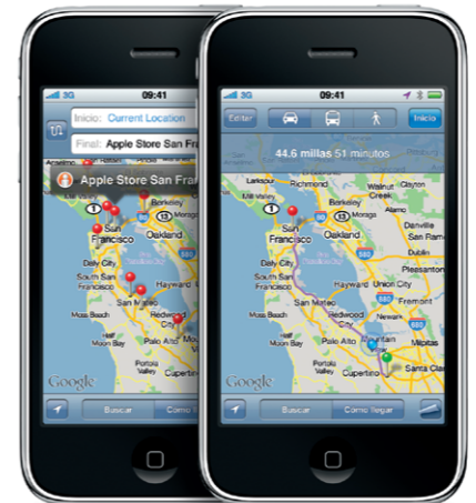
Google, el logotipo de Google y Google Maps son marcas comerciales de Google Inc. © 2010. Todos los derechos reservados.

En Mapas, pulse Cómo llegar e introduzca un punto de origen y un punto de destino. Puede utilizar su ubicación actual, escribir una dirección o seleccionar una dirección en los contactos o en las ubicaciones que haya marcado como favoritas. Pulse Ruta para mostrar las indicaciones de conducción. Pulse el botón Caminar para obtener indicaciones si va a pie, o bien pulse Autobús para ver las rutas y los horarios de las líneas de transporte público. El iPhone detecta y muestra el avance a lo largo del trayecto que haya elegido.