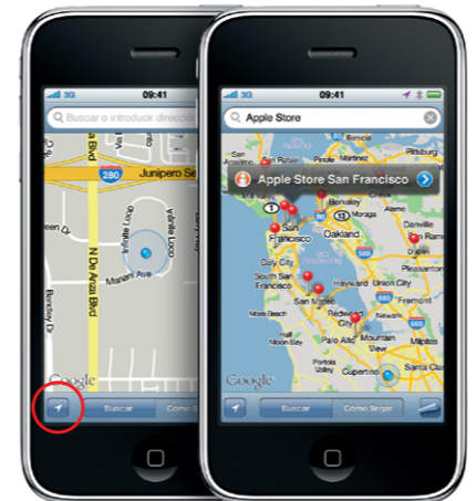
Google, el logotipo de Google y Google Maps son marcas comerciales de Google Inc. © 2010. Todos los derechos reservados.

Para ver su situación en un mapa, pulse el botón Ubicación. Aparecerá un punto azul en su posición actual. Para conocer su orientación, pulse de nuevo el botón Ubicación para activar la vista de brújula. Puede encontrar lugares cercanos escribiendo palabras como, por ejemplo, "Starbucks" o "pizza" en el campo de búsqueda. Pulse dos veces para acercar el mapa. Pulse una vez con dos dedos para alejar el mapa. Pulse el botón Pasar página para configurar la visualización del mapa.